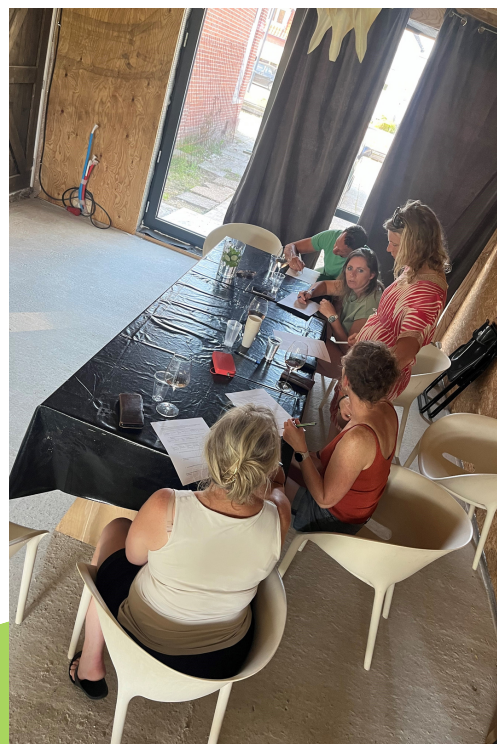
Workshop voor ouders in Nederland

Learning Hub Friesland uit Nederland heeft de afgelopen maanden flinke stappen gemaakt in het project Digitale Opvoeding. Hun inspanningen omvatten onder meer het hosten van twee productieve Digital Upbringing Community Partnership-bijeenkomsten, voornamelijk bijgewoond door onderwijsorganisaties. Deze bijeenkomsten dienden als platform voor het stimuleren van discussies over de lopende digitale workshops, bijeenkomsten en andere initiatieven binnen deze organisaties, evenals de bijdragen van ouders tijdens deze evenementen. Deelnemers deelden inzichten, zowel vanuit hun professionele perspectief als persoonlijke ervaringen als ouders, waardoor de organisatoren praktische en waardevolle inzichten kregen. Deze dynamische samenwerkingsbijeenkomsten