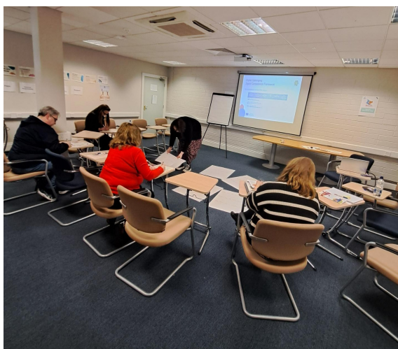
Bijeenkomst van de lokale werkgroep in Kells, Ierland

HRABRI Telefon (Brave Phone) is een niet-gouvernementele, non-profit organisatie die in 1997 is opgericht met als doel directe hulp en ondersteuning te bieden aan mishandelde en verwaarloosde kinderen en hun families. Zij werken aan het voorkomen van mishandeling en verwaarlozing, maar ook grensoverschrijdend gedrag van kinderen en jongeren. Hun eerste ontmoeting was gericht op elkaar leren kennen, zodat ze een partnerschap konden opbouwen. Dante heeft besloten een korte online meeting te houden aangezien de partners uit verschillende steden komen. Ze bespraken ook de mogelijkheid om in september 2023 deel te nemen aan het gezamenlijke traingevenement in Cyprus.