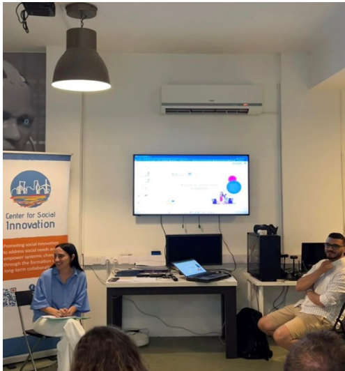
Workshop voor ouders op Cyprus

Naast deze bijeenkomsten heeft LHF hun eerste workshop speciaal voor ouders georganiseerd. De workshop was gericht op competentiegebied 1 van het competentiemodel voor digitale opvoeding en verkende intrigerende onderwerpen, zoals deepfake-technologie, "gratis" online apps en de fijne kneepjes van algoritmen voor sociale media. Ouders namen actief deel aan stimulerende discussies, deelden hun ervaringen en voerden spraakmakende gesprekken. De organisatoren zijn verheugd te kunnen melden dat de workshop de verwachtingen overtrof, met deelnemers die hun plezier uitten over de "uitwisseling van tips en ervaringen" en hun waardering voor de overvloed aan "interessante en bruikbare kennis".