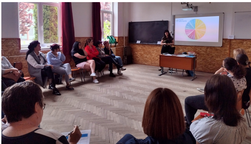
Workshop voor ouders in Roemenië