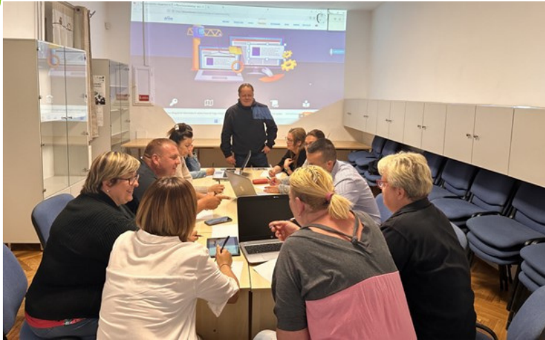
Workshop voor ouders in Hongarije